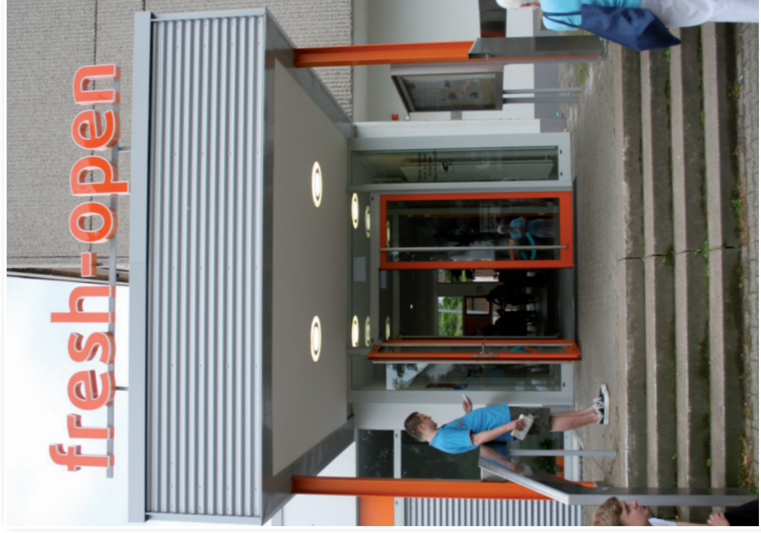
„Eingang Freizeitbad fresh-open der Stadt Frechen“

Einige unsere Mitglieder werden sich schon mal gefragt haben, was bedeutet eigentlich der Name „fresh-open“? Die Stadt Frechen, vornehmlich die Leitung des Freizeit- und Bäderbetriebes, wollten dem damaligen Hallenbad mit einem Namen eine neue Identität geben. Wie aber einen geeigneten Name finden? Die Frechener Bürger sollten mitentscheiden. Über eine Ausschreibung mit vielen Vorschlägen ist es dann zu der Bezeichnung „Erlebnisbad fresh open“ gekommen. „Fresh“ ist abgeleitet worden aus dem Frechener Platt „Freschen oder Freshen“. Die Bezeichnung „open“ war damals, in der Hochzeit des Tennis mit Boris Becker und Steffi Graf, groß rausgekommen. Wie zum Beispiel in Frankreich French-open oder Australien-open usw. Frechen ... fresh-open bedeutet: frisch und offen.